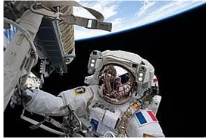
L'astronaute Thomas Pesquet dans l'espace

5 « Partir vers Mars, c'est un projet fou et les risques sont immenses. Si on a un problème lors de l'aller, depuis le premier jour, par exemple, il est impossible de faire demi-tour. On est obligé de faire les 300 jours de voyage aller, le tour de la planète et les 300 jours retour. Un petit problème (une dent qui fait mal, un moteur qui ne fonctionne plus, un manque d'oxygène ou de nourriture, etc.) peut prendre une importance immense. »