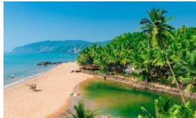
Les plages de Goa

L'Inde est probablement le pays le plus touché par le nombre de morts lié à la prise de selfies qui ont mal tournés (devant la Russie et les États-Unis). On veut faire quelque chose contre cela : dans des zones à risques, comme par exemple sur certaines plages de Goa ou certains lieux à Bombay, des zones sont tout simplement